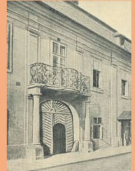
str. Constantin Noica 48 6

La începutul secolului al XVIII-lea pe aceste locuri se aflau grădinile din fața Porții Cisnădiei, distruse ulterior. Samuel von Brukenthal le-a replantat parțial și și-a construit aici reședința de vară, terminată în jurul anului 1772. Ani buni edificiul s-a numit „Conacul Cucoanei”, el aparținând unei descendențe a baronului, când aici a și funcționat un internat de fete, dar și sediul vămii.