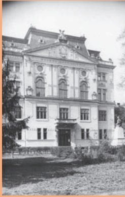
Str. G. Barițiu 5-7 1