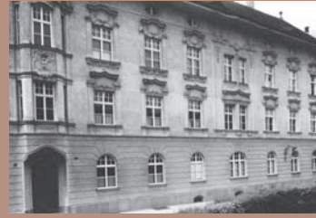
Str. G. Barițiu 1-3 2

Inaugurat în 1934, clădirea a servit aproape permanent scopului pentru care a fost construită, funcționând ca unitate sanitară de atunci și până în zilele noastre.