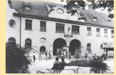
Str. Andrei Șaguna 1 3

Situat în centrul orașului, lângă Hotelul Bulevard, clădirea acestui complex este una dintre cele mai vechi construcții de interes public ale Sibiului. Fosta Baie Populară a fost inaugurată în 1904 și este o copie a Băii Müller din München, ambele edificii fiind creația bavarezului Karl Hocheder, îmbinând stilistic forme ale barocului cu elemente de „Jugendstil” de sfârșit de secol XIX și început de secol XX.