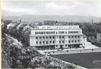
Bd. Bălcescu 53 4

Informalul, dar celebrul loc de întâlnire al sibiienilor (în fața la „24”) era pe vremuri intersecția dintre străzile Cisnădiei (Heltauer) și Cetății (Harteneck). Acolo, în locul a două clădiri tipice centrului istoric care adăposteau o cofetărie și o farmacie, Societatea de Asigurări „Prima Ardeleană” din Cluj ridică în 1934 Palatul filialei sale din Sibiu. Pe la 1950 în fața clădirii se găsea unicul semafor din oraș.