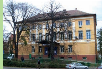
str. Constantin Noica 20 5

Clădirea a fost realizată după planurile arhitectului Otto Wagner la sfârșitul secolului al XIX-lea, și se află astăzi într-un cartier rezidențial, în partea sud-estică a orașului vechi, cu străzi drepte și intersecții de 3 sau mai multe căi rutiere.